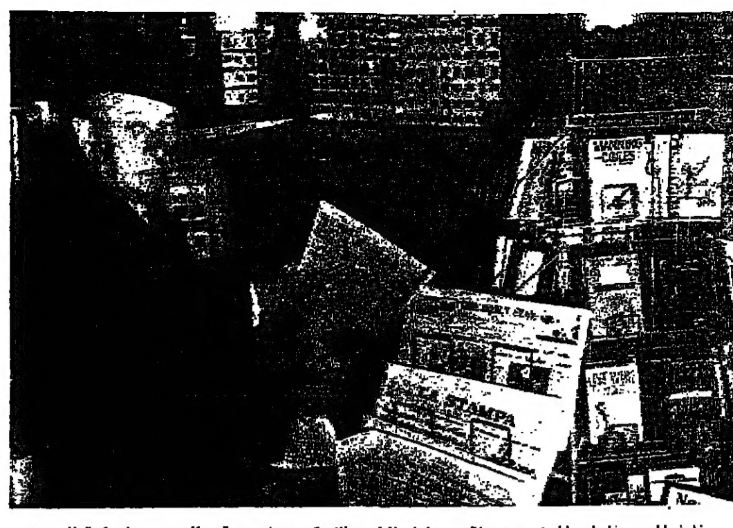
فاج المصور غلطي المسر بوجين بك مستشار الرئيس المصري بصفحجريدة ( الدستور ) في مكتبة تشفيق الزرن ... تكلمت هذه الصورة

وكم يرضي هؤلاء في زعمهم هذا على التاريخ القديم والحديث بل على تاريخ هذه الأمة وجزءها بل على الأمم على السواء ، حين يربطون بين صفات كنهه فسي اللغة ، وبين هزيمة في حرب 1948 من نسي هؤلاء أقاس ، ان العربي عبر الزمن ، كانت تتفهم بلاغة لغته وانتمائه بها المسمى الاستيعاب والاستيعاب في الغالب ! بل نسوا التاريخ فخران المجاهدية في وقتهم ، وأراجز فرسان العرب وتصيهم في مسارك القادسية والرموك والجنديين ؟ هل من ضرورة التي تفرهم باعتبارها معوية بن أبي سفيان ، أنه كان على وشك الهرب من ( صين ) ، أو أن تذكر أبنائها حامية لعمرو بن الخطاب ، رمت عليه نفسه وشجاعته ؟ ثم . . . من نسي هؤلاء القس التي تضيء ( المرسلين الفرنسي ) حروبهم بعد تورهم الشهيرة كعد قال أحد هؤلاء الفرنسيين الشر معركظفرة لبني قومه : ( انصرونا ) وكان المرسلين ) يقال معنا ! ويرغم ما عرف من الأطنين من جنوح شديد إلى التخطف وعم من الاستيعاب للاستيعاب ، فقد تكروا لتترتب عندهم تقوده ، وتلك